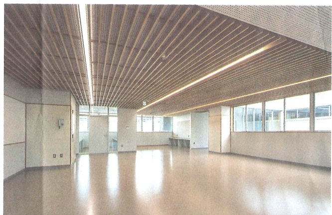
東校舎 4階学年共通スペース