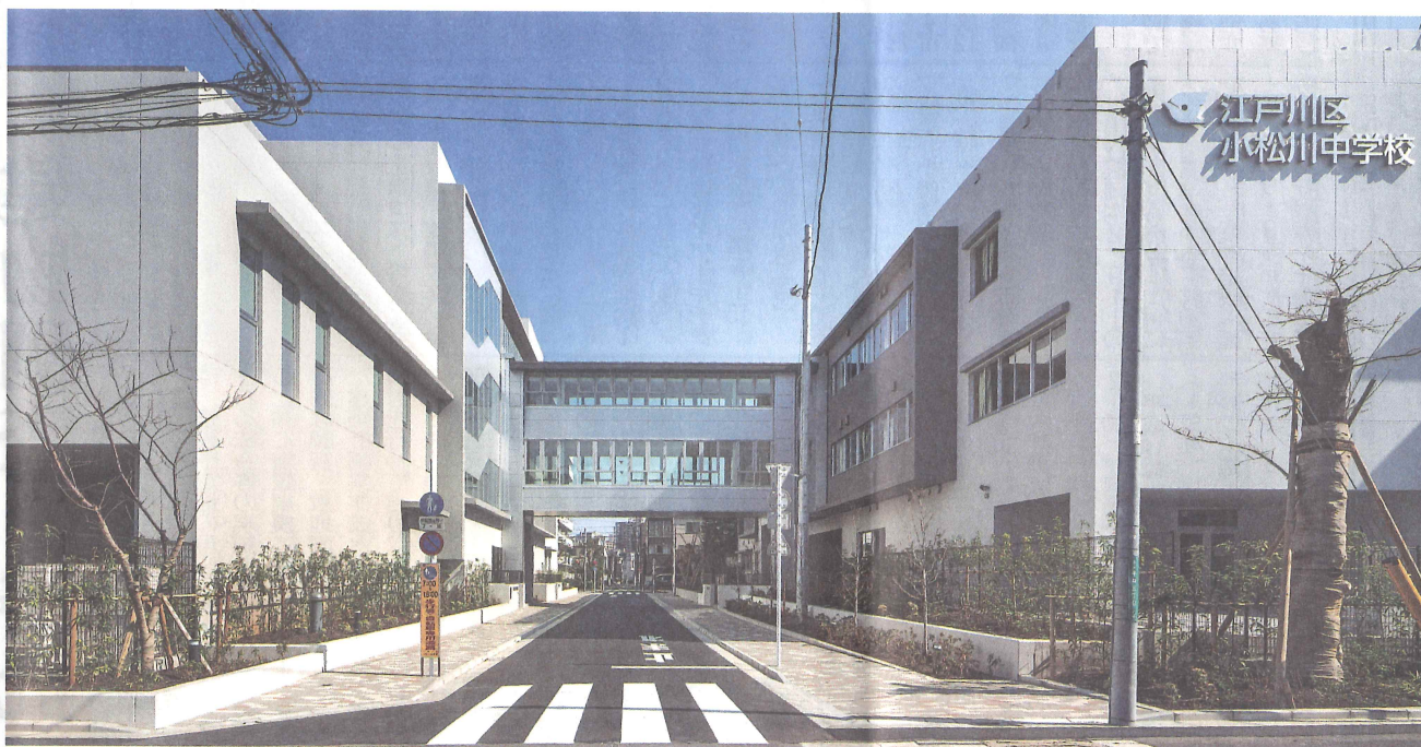
渡り廊下北側全景

江戸川区立小松川中学校改築工事が完成した。同区では、児童・生徒にとって望ましい学習環境が提供できるよう学校規模適正化に取り組んでいるが、そのひとつとして小松川・平井地域でも、生徒が適正な学級規模の学校でより充実した教育が受けられるよう、小松川第一中学校と小松川第三中学校を統合するとともに、小松川第二中学校(夜間学級)を移設したものである。設計は、株式会社IINA新建築研究所、施工は、関東・塚本建設共同企業体が担当した。